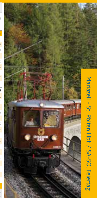
Mariazell – St. Pölten Hbf. / SA-SO, Feiertag