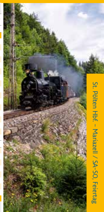
St. Pölten Hbf. – Mariazell / SA-SO, Feiertag